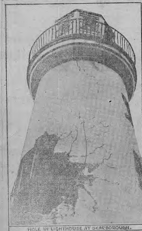
HOLE IN LIGHTHOUSE AT SCARBOROUGH.

Este grabado es de una de las primeras fotografías llegadas a la América, en las cuales figura el daño causado por los cruceros alemanes en la torre del faro de Scarborough, durante la correría que realizaron algunos barcos contra las indefensas poblaciones de la costa inglesa. El faro que está situado sobre una peña muy alta, constituía un magnífico blanco para los cañones de los barcos alemanes, cuyas granadas demolieron muchos edificios y mataron a muchísimas personas.