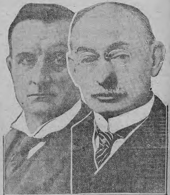
SIR EDWARD GREY AMBASSADOR PAGE

En este grabado aparecen los dos grandes personajes del día en el asunto de la nota enviada por los Estados Unidos a Inglaterra exigiendo que no se inter venga en la navegación de los barcos mercantes americanos que se dirigen a puertos neutrales. Los Estados Unidos tienen entera confianza en que el asunto se resolverá favorablemente y en caso contrario están dispuestos a exigir de Inglaterra daños y perjuicios. Esta controversia es muy parecida a la que motivó la guerra entre Estados Unidos e Inglaterra en 1812. El grabado de la izquierda muestra a Sir Edward Grey, Ministro de Relaciones de la Gran Bretaña a quien fue entregada la nota por el Embajador americano, Page, quien se ve en el grabado de la derecha. Como nuestros lectores saben, esa nota ha sido ya contestada por Inglaterra.